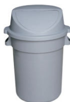
TAPA CON CUBIERTA ABATIBLE INCLINADA