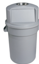
TAPA CON CENICERO Y COMPUERTA ABATIBLE